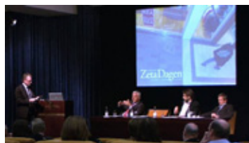
ZETADAGEN AVHÖLLS PÅ GRAND HOTEL I STOCKHOLM

Med fokus på mötet med kunden i butik och Digital Signage som ny mediekanal, genomfördes den 22 oktober Nordiska ZetaDagen 2009 på Grand