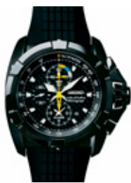
KAMPANJ FRÅN PROTID

Protid Urmakarna med drygt 30-talet butiker i Norge har valt att investera i ZetaDisplays medieplattform för Digital Signage. På displayerna skall visas kampanjer samt filmer från varumärkesleverantörer. Det kommer via displayer vara möjligt att gå in på kedjans hemsida och visa kunden olika klockmodeller. Protids målsättning är att framstå som den ledande urmakaren med fackkunskap och märkesprodukter som grundläggande värde. Detta kommer till uttryck genom deras nya slagord; "Av kärlek till fackkunskap". Protids satsning på Digital Signage är ett led i kedjans nya kommunikationsstrategi där man satsar på de moderna medierna; TV, Internet, Sociala Medier och nu också Digital Signage från ZetaDisplay. Protid ser det som nödvändigt att investera i moderna medier i butik. Protid anser Digital Signage vara en förutsättning för att driva en modern butikskedja i framtiden. ZetaDisplay är glada att få vara en utvald leverantör till Protid. ZetaDisplays medieplattform ligger i absolut framkant vilket visar sig genom bolagets starka erbjudande och nära samarbete med nöjda kunder. ZetaDisplay lägger nu med Protid ännu en ny kund till sina referenser i Norden. Ordervärdet uppgår till drygt 1 MSEK och installationer till butikerna sker under april/maj 2010.