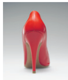
SKOKEDJAN GARANT VÄLJER ZETADISPLAY

Skokedjan Garant Nordic har valt ZetaDisplays plattform för Digital Signage till sina butiker. Kedjan omfattar bl a 80 butiker i Norge. Lösningen är baserad på 2 skärmar, en kampanjtorgsskärm och en skärm i kassan. Kampanjskärmen visar information om nya produkter. Skärmen i kassan syftar till att öka försäljningen på kassanära produkter, som exempelvis impregnering, skokräm och skosnören. Garant Nordic verkar på den nordiska marknaden, med butiker i både Norge, Sverige och Finland. Installationer avser i ett första steg butikerna i Norge. Garant Nordic är en del av den tyska skokedjan Garant Schuh + Mode AG med sammanlagt mer än 5 400 butiker i Europa.