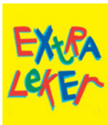
EXTRA LEKER INVESTERAR I SINA BUTIKER

ZetaDisplay har tecknat avtal med Extra Leker A/S i Norge avseende leverans av ZetaDisplays plattform för Digital Signage i deras butiker i Norge och Sverige. Extra Leker har valt att utrusta sina 16 butiker i Norge och Sverige med en lösning baserad på 3 till 4 monitorer i varje butik, en vid entrén och resten vid olika kampanjplatser i butikerna. Syftet är att via rörlig film visa upp de olika funktionerna i leksakerna och beskriva hur barnen använder dem i lek. Extra Leker är en kedja som investerar i stora butiker med leksaker till ett attraktivt pris. Att kommunicera med hjälp av digitala rörliga media är viktigt för kedjan då barn är upptagna med nya och moderna media och låter sig inspireras av skärmarna. Extra Leker ser lösningen med Digital Signage som en viktig komponent för att även i framtiden driva en framgångsrik leksakskedja. Kedjan har de senaste åren haft en stabil tillväxt och har som mål att växa ytterligare med hjälp av ZetaDisplays lösning för Digital Signage. Ordern värderas till 1,5 MSEK.