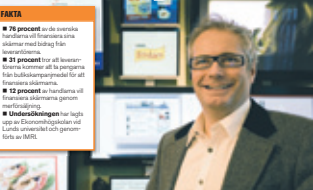
Butiks-TV är den nya kanalen för butiks-TV. Den är en ny kanal för butiks-TV...