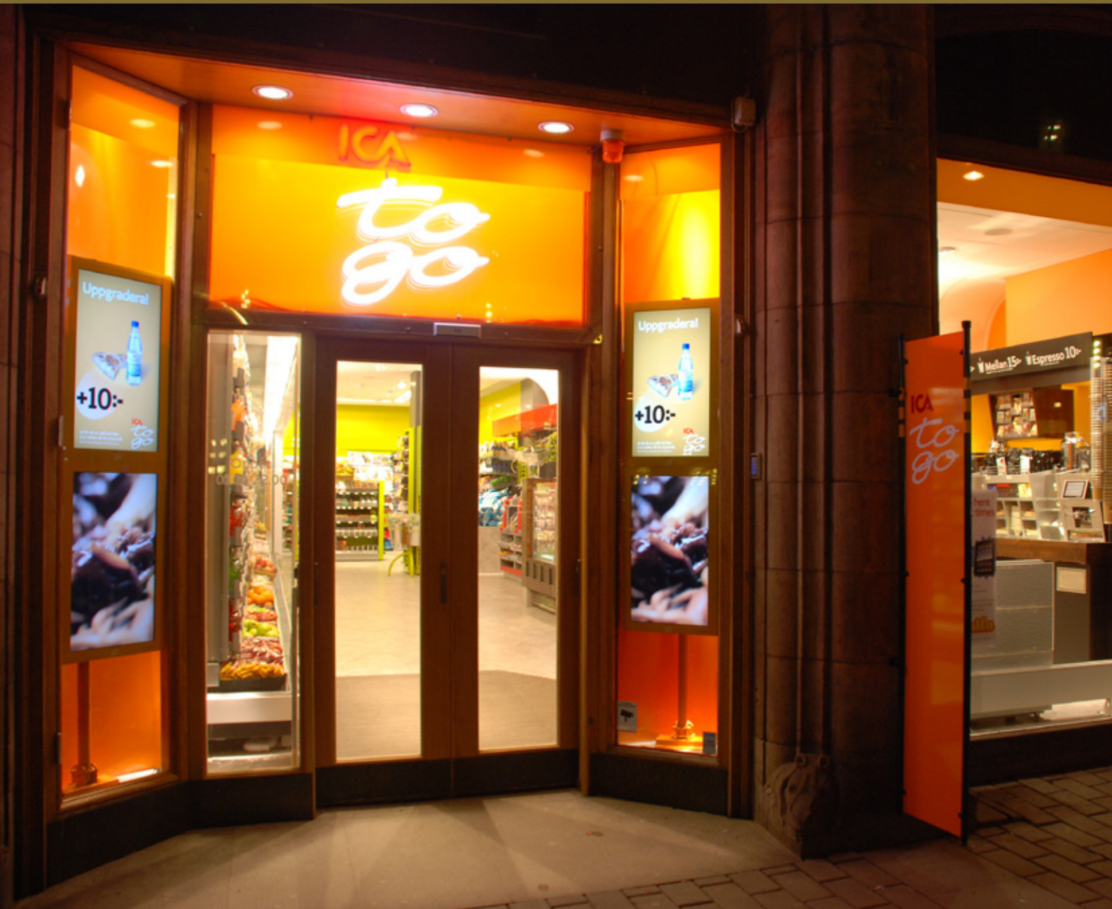
DIGITAL SIGNAGE INSTALLATION HOS ICA TOGO I STOCKHOLM