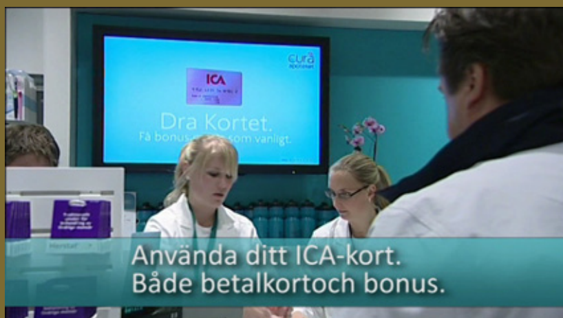
ICAs NYA APOTEKSKEDJA CURA APOTEKET