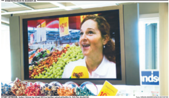
STOR INTERESS. Sedan i hösten har drygt 100 butiks-TV:n utsläppt på butiks-TV. Och förklarar det...