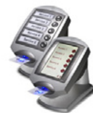
ZETADISPLAY SAMARBETAR MED Q-MATIC

ZetaDisplay har inlett ett samarbete med Q-Matic som är världsledande inom kö-system och effektivisering av kundflöden. Samarbetet går ut på att ZetaDisplay har utvecklat en kompletterande komponent till sin medieplattform för Digital Signage, vilket gör det möjligt att Q-Matics kö-nummer kan visas i en butiks