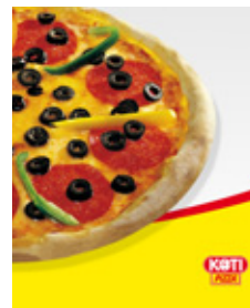
NYETABLERINGAR UTÖKAR ORDERN FÖR KOTIPIZZA

ZetaDisplay tecknade under slutet av 2009 avtal med Finlands största pizzakedja, Kotipizza, som satsar på digitala bildskärmar för att informera om menyer och aktuella erbjudanden i sina restauranger. Kotipizza ersätter traditionella menytaflor och affischer med Digital Signage. Lösningen erbjuder en helt ny dimension för hur information produceras och distribueras i restaurangbranschen. Ordern avsåg i ett första steg 200 restauranger och har nu utökats med 60-talet nyetablerade restauranger. Det ursprungliga ordervärdet på 15 MSEK har härmed utökats med ytterligare ca 4,5 MSEK.